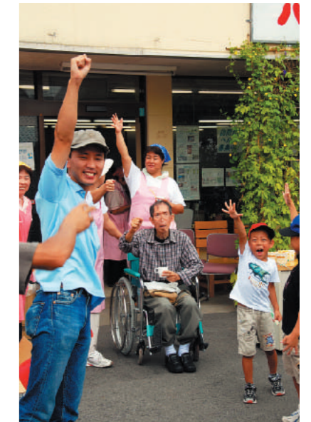
ハートフルの事務所前で

また、コストを低減させるための活動も行なっている。農家と直接契約することで、配食の原材料を安くするのは当たり前。活動を終了させるという介護事業者がいると聞きつけると、そこをお願いして、今まで使っていた自動車を買い付けてくることで、すでに介護用に改造されている自動車を安く手に入れるなど、あらゆるアイデアを駆使している。