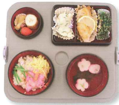
↑保温容器に入れ温かいうちに届けられる、配食サービス「まごころ弁当」