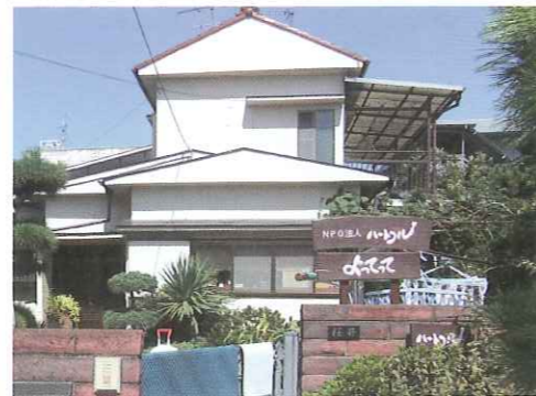
↑代表の実家を改装したデイサービス「よってって」