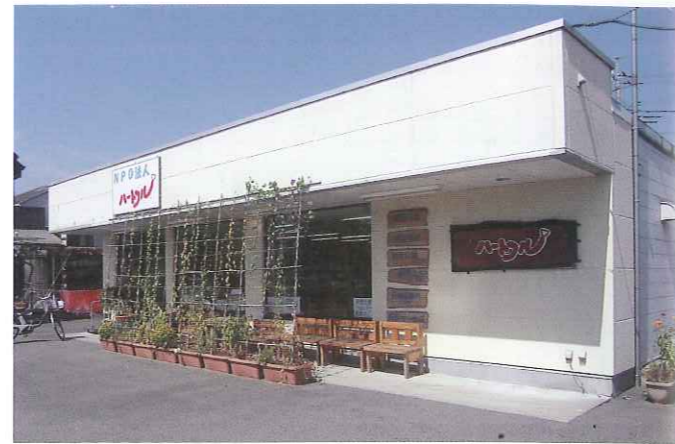
↑NPO法人 ハートフル事務所及び配食センター外観

設立当初から実施している事業は、配食サービスとたすけあい事業である。「配食サービス事業」では地域の食材を使用し温かいうちに配達、希望に応じおかゆや刻み食等にも対応する。配食を楽しむ高齢者からは、夕食も配達して欲しいとの声が寄せられている。また家事の応援や草むしり、入院中の洗濯などを支援する「たすけあい